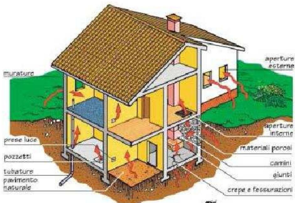
Fig. 3 - Punti d'infiltrazione del radon nell'edificio

L'infiltrazione costituisce il secondo fattore importante nel determinare l'ingresso del radon nelle abitazioni (Fig. 3). Essa può verificarsi in corrispondenza di: